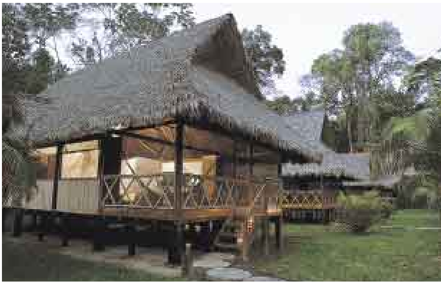
INKATERRA. El diseño del albergue está inspirado en la arquitectura de las comunidades nativas.