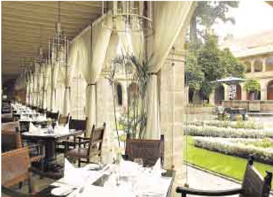
ÚNICO. El Hotel Monasterio participó como parte de la colección de lujo de Orient-Express.

■ NUESTRO PAÍS OBTUVO CUATRO GALARDONES OTORGADOS POR LA ASOCIACIÓN LATINOAMERICANA DE TURISMO, DURANTE LA FERIA MÁS IMPORTANTE DEL MUNDO EN ESTE RUBRO CELEBRADA EN LONDRES