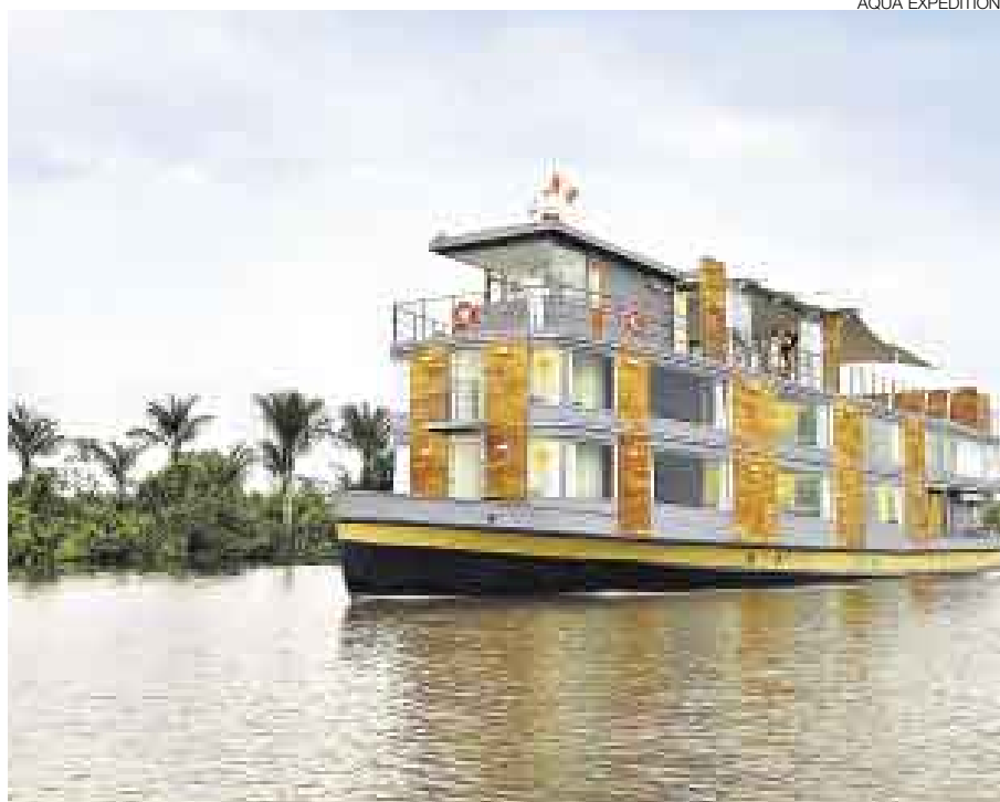
AMAZONÍA. El crucero de lujo Aqua fue seleccionado como el idóneo para expediciones.

El premio en la categoría de Mejor Albergue de Selva en Latinoamérica se lo llevó Inkaterra Reserva Amazónica. Aqua Expeditions ganó el máximo galardón en el